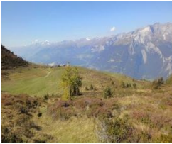
Alp da Veulden