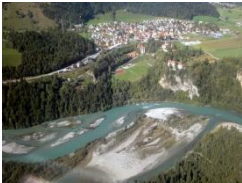
Blick in das Rheintal