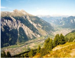
Sicht von Feldis

Feldis Seilbahnstation 1460m - Alp da Veulden 1946m - Emser-Hütte "Term Bel" 1940m - Dreibündenstein 2160m - Spundisköpf See 1812m - Malixer Alp 1759m - Brambrüesch PP 1600m - Bergstation Seilbahn 1594m