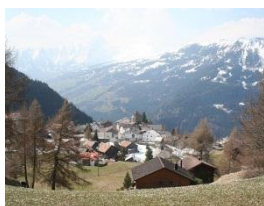
Das malerische Feldis