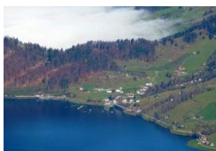
Innerthal am Wägitalersee